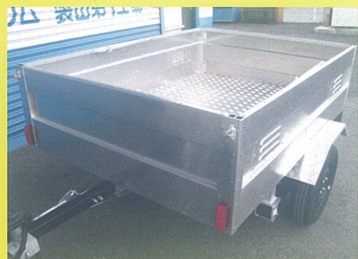
トップカバーなし・サイドブレーキ付き ¥346,500.-