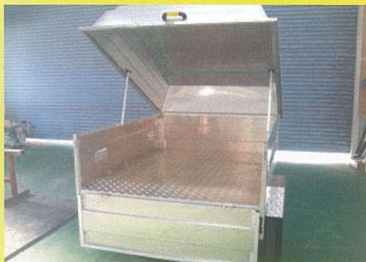
トップカバー・サイドブレーキ付き ¥420,000.-